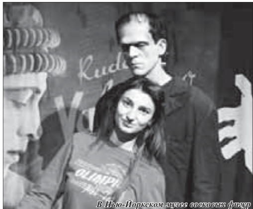
В Нью-Йоркском музее вожжовых фигур