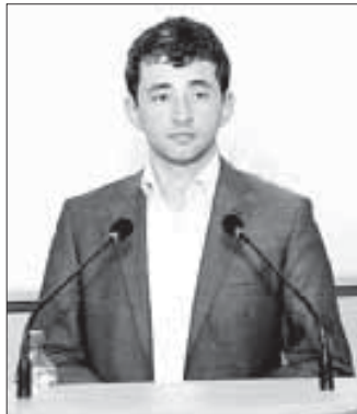
– Нобэклэ сыт хуэдэ луэхухэм аужь фит?

– Шэч хэмьлуэ, Шалэгьуалэ палатэм аужь кьинэнкэ Иманлэ имьлуэ унэтлэныгыэ зэхуэмдэхэр илэщ. Ауэ абы кьыкьыр-кьым дэ абыхэм флэка нэгьуэш луэхухэм демьлэжэу. Цыхухэр зэрьэхуэмдэм ешхуэ, абыхэм ялэ зэфлэкири, зэлэжын хуейри, яфлэгьэлэгьэуэни зэхуэдэжэу. Абы кьыхьэки, дэ зэрьлэпкэклэ, а унэтлэныгыэ псори кьызэ-рызэцлэдуьыдэным иужь дитщ. Шхьэж илэ унэтлэныгыэ елытауэ ирегьэфлэкуэ. Дэтхэнэ зьми жоуплэныгыэр зыкьилэуэ луэхур и пэцэ дилхьэжэу зэфлигьэклэуэ есэн хуейт.