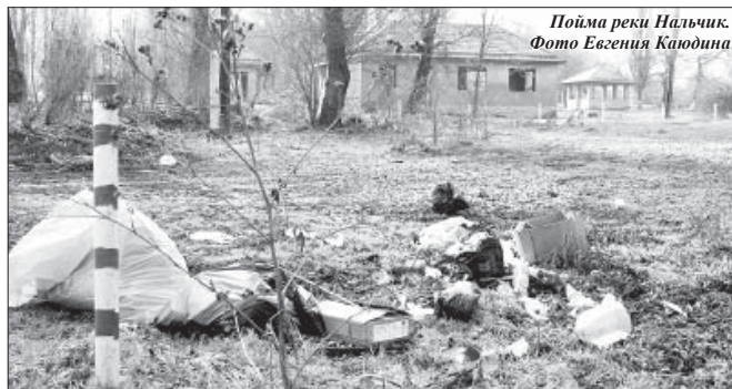
Пойма реки Нальчик.

А на состоявшемся в тот же день заседании правительства КБР было принято решение о создании межведомственной комиссии, которой поручено проверить расходование бюджетных средств, выделенных на строительство мусороперерабатывающего завода. Планируется, что ее работа будет завершена до 1 мая.