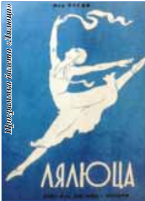
Хореографический балет «Лялюца»