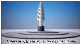
Проект «Древа жизни» для Майкопа