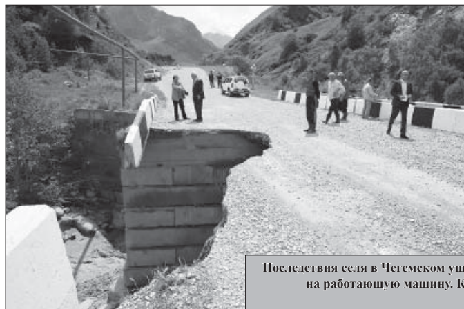
Последствия селя в Чегемском ущелье. Справа: огромный камень упал на работающую машину. К счастью, обошлось без жертв.

Аналогичные проверки проводятся во всех районах республики. Итоговый отчет будет представлен правительству КБР.