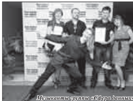
Музыканты группы «Сфера данных»