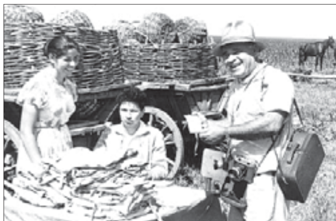
Уборка кукурузы. 1960-е