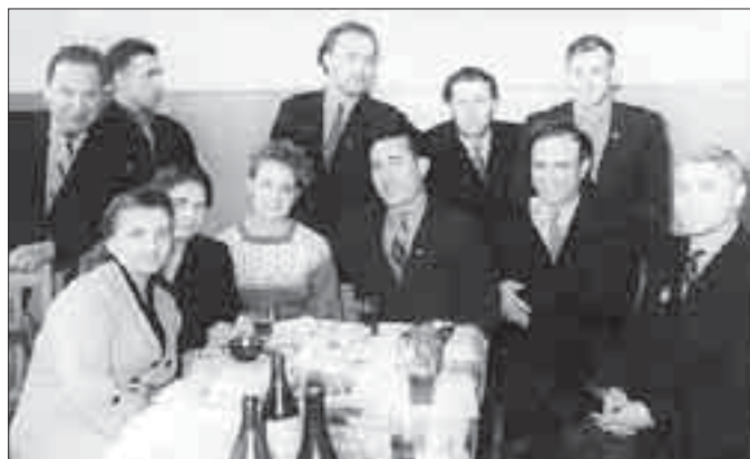
Конец 50-х. Коллектив «СМ»