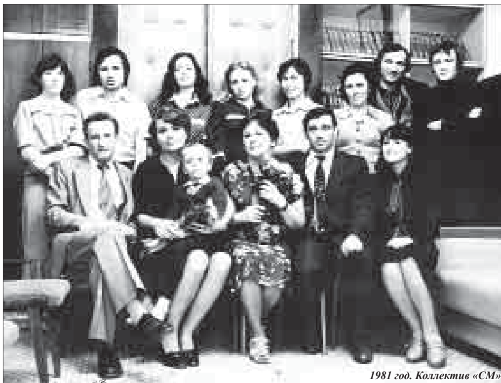
1981 год. Коллектив «СМ»

Публикуя сегодня редакционные фотографии разных лет, мы хотим, чтобы вы вспомнили еще раз годы своей работы в газете, вспомнили себя, своих коллег и друзей молодыми, веселыми, умеющими одинаково хорошо работать и отдыхать. И пусть годы работы в «Молодежке» всегда остаются у вас в памяти, как самые лучшие, самые насыщенные событиями, самые интересные и веселые.