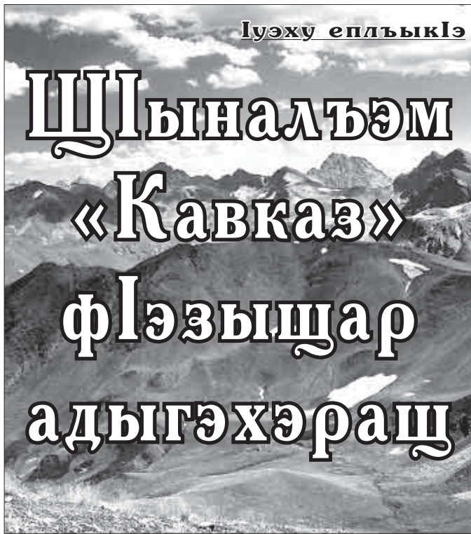
Ильэс зьыбжанкГэ үзлэбкфьжмэ, газетхэм кьытехуауэ цыташ «КАВКАЗ» псалэм и кьэхькүлэм теухуа тхыгээ. «Топонимия - это интересно» тхыгээр зи Идакэцлэжкыр Зейкүү кьуажэм цыц Дюедьф Аслъэмйрээт. Абы и тхыгэм кфцлү кьыцеуатэ «Кавказ» псалъэр кьэзэрхьуар. Аслъэмйрээ зьыбжанкГэ, ар «къвэ», «къвэ» псалъээр зьыгуэр кьэхьуаи. «Къвэ»-р е узиси е мыши, «къвэ»-р кьэвэжиа усунсыр «зын», гэкэбээ» кьиклуу кьегээлгьауэ. А псалъээр зехлэхьэжэ, урысыбэм ирегзэуэрэ, «Кавказ» псалъэр кьэзэхьэ.

Нэгдүгээр Зейкүү эцлэл, егьэджаклузу, шол унафшлу ильэс куэдкү лэжа Абытү Хэжмурати илэц «Кавказ» псалэм и кьэхькүлэм теухуа тхыгээ, ари газетым тетац. Хэжмурат и еплыкүмКлн, Аслъэмйрээ и псалъ «къвэ»-р кьегьээбөл, етүлануу кьиштэр «кьес» жыхуилэрш. «Къвэ» шхьэккэ «кьес» уилэн хуейш. А түри зэхэплхьэжмэ, «Къвэкьес» мэху, ауэ урысыбэм ибгьэтлэсэн шхьэккэ «Къвэс» е «Кавкос» пфлюху, анхуэдэ зэхэлхьэккэжэр бээцлэныггэм кымьштэнкГэ шэч кьыгуегьэх.