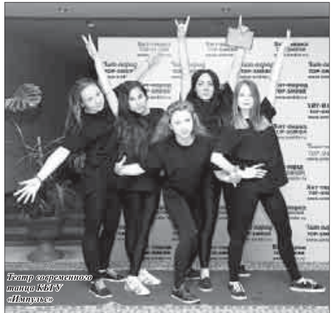
Театр современного танца КБГУ «Импульс»