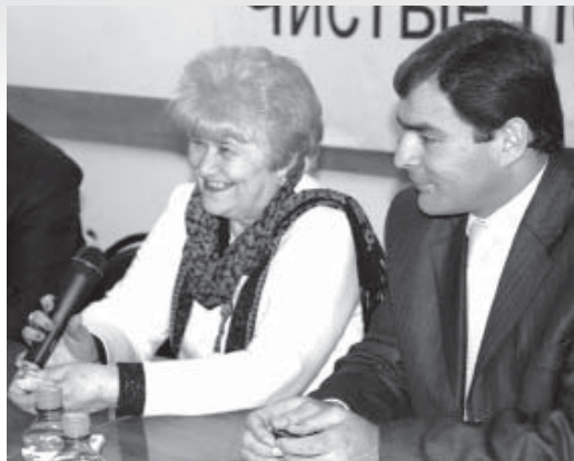
Сен айырма ансы Ата журтумдан!»

Кюн жумдурукларынг тийген кюнде да, Жай сууук бузларынг тойген кюнде да, Ачый баргында да шинжи жолунда: «Насыплым, - дедим, - сени кыолунда». Бет бургынымда да жут желлеринге, Тюртолгенимде да ертеелеринге, Тилдем жашаудан: «Кюйдор отунда,