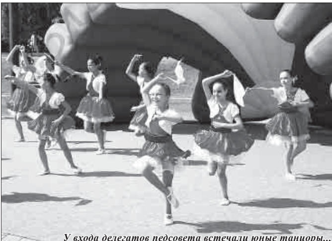
У входа делегатов педсовета встречали юные танцоры...