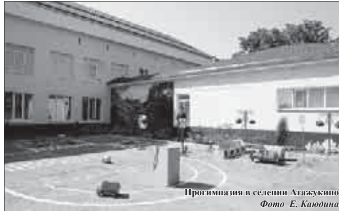
Прогимназия в селении Атажукино