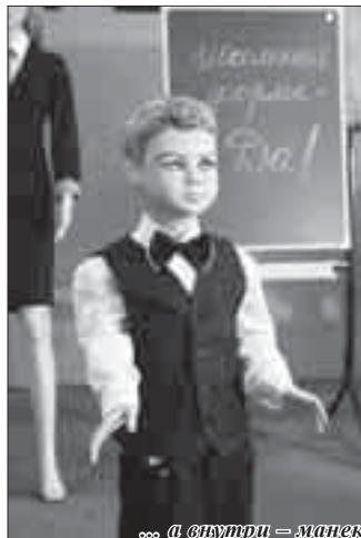
... а внутри – школьники в школьной форме