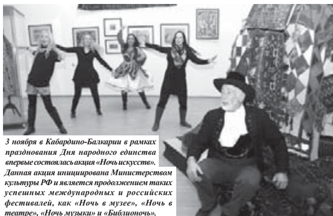
3 ноября в Кабардино-Балкарии в рамках празднования Дня народного единства впервые состоялась акция «Ночь искусств». Данная акция иницирована Министерством культуры РФ и является продолжением таких успешных международных и российских фестивалей, как «Ночь в музее», «Ночь в театре», «Ночь музыки» и «Библионочь».

Если в Государственном национальном музее «Ночь искусств» носила ярко выраженный национальный колорит, то в Государ-