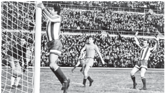
Тбилиси, стадион «Динамо». 1964 г. Встреча «Динамо» Тб – ЦСКА, счет 3:0. На снимке – первый гол в ворота ЦСКА.