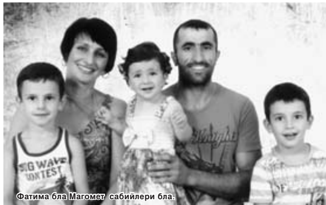
Фатима бла Магомет сабийлери бла.

турабыз. Алай Фатиманы кырачы - малкыар тепсеуледе кыраган сыфатарын кыратарык, аланы унуттурлуга а чыгармы, билмейме.