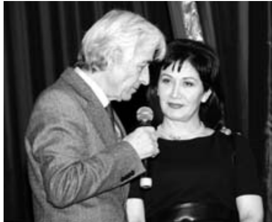
Джабраил Хаупа Джамиля Хагарованы алгъышлаиды.

сюйгенле жыйылгандыла. Бу проектге аталып, залны фойесинде уллу кёрмюч да къурагъанды.