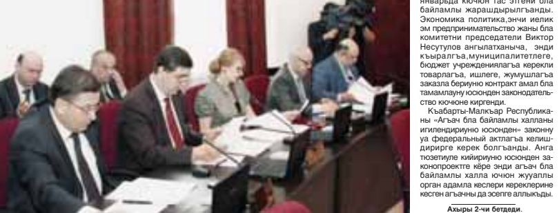
Хыры 2-чи бетиди.

КЪМР-ни Парламентини президиуму спикери Чеченланы Ануарны башчылыгында бардырылган кезуеу жыйын «Къабарты-Малкъар Республиканы тыш къыралда ата журтлударыгъа бла байламлы къырал политикасыны юсюнден» КЪМР-ни Законну тюзетиле кийриуню юсюнден» законопроектни озюнден башланганды. Аны ангындан КЪМР-ни прокурору эсгертиле этгени бла байламлы жарашдырырга тышгенди эмда ала барысы да эсге алыннгандыла.