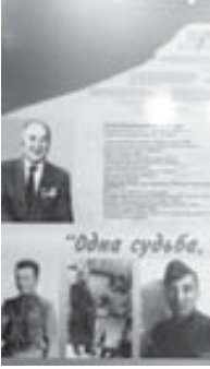
"Одна судьба, одна дорога, одна победа на века..."

Былада ёмюрлюк шүөхлүкүнү, теңгилик пропагандасы - эңи темады. Күүлү улу бу Кешоковну хайрындан битүү дунда малкыр бла къабартлы халкыла тандыдыла» - деп Беппай улу бу көрмю мындан ары бийик окуу юйлөдө, школлада да көргөзтөлгөнгө шынганын билдиргенди.