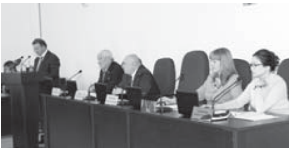
Эл молюк техниканы сабан ишлеге хазырлыгыны юсюнден да сөз бергенди.

Тахта кегетле өсдорлолук жерлени хазырау къыстау бардырылады. Быйыл 25-чи мартта жалкык битимленурудукларды 6 минг гектарга сөбилгенди, 20 гектар жерге семиртичле берилгенди, 500 гектар жерде терекке орнаттылкъыдыла.