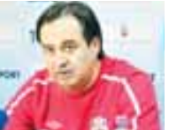
БИДЖИЛАНЫ Хасанни «Спартак» баш тренери: Волгоградда ий умутула бля атланган эдик.