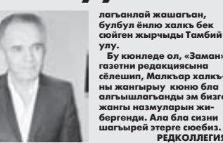
лаганлай жашаган, булбул ёнло кылак бек сойгон жырчыды Тамбий уу.

Малкзарны анты Шуку жырчы Кьасбот (Тамбийланы Кьасбот) жангы чыгармалары бля бизни дайым да кыууандырганылай турды. Алада уа Шам Кыара- чынны айрымалы жашы Малкзарга сыйкемликни сагынымай кыюймды. Халкыбызны жан, кыан, ант бирлигин багылап- алат, четргеней, жыр-