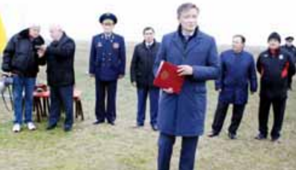
Андан сора ала СССР-де реактивнй двигатели болгьан биринчи «ИРД 09» ракетасыны моделин кёкге ийгендиле. Аны бля эришуле да башлангьандыла. Алагьа Россейден, Къазахстанда бля Кырымдан 150-дан аслам эм кучлю