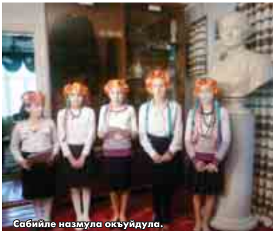
Сабийле назмула окъуйдула.

Озган ёмюрню аллында бу фахмулу тишириу Долинскдеги гитче юйчюкде жашаганды, бусагьатда ол жазуучуну музейича белгиледи. Ол малкъарлыла бла шуёхлукъ жюрютгенди. Бизни поэтле да анга назмула жоралагандыла.