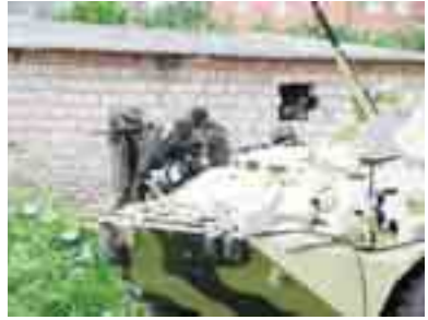
КъМР-де Оператив штаб.

ген кезиуде Набережная орамда койлоден биринде законсуз сау-ултанган амалькычы кызаум-лары келечилери жашагандыла тохтадырылганды. КъМР-де Оператив штабы кылулукчулары ала бла селешти, юйно иесини эмда аны тют сабийн эркин эт-диргенди. Алай сауларгыкызы-ны кыюгузусу денде уа, бандитле кюч структураны адамларын ачкандыла. Спецоперацияны кезиндеде юч амалькычы жок этилгенди, аланы арасында бандит кызаум-ну башчысы да. Ол 1987 жылда тууган жаш эди, кеси да феде-