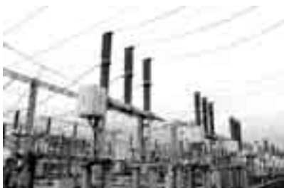
шөндюго автоматика кергютюрюкю.

Энергетикле токну ёчюлткуч эски аппаратураны орунуна къоркучулуу, ышангылыуу да иги болгъан жангы тюрюлерин салгъандыла. Тозураган бетон конструкциялары орунуна уа темирден ишленген чыпыла орнатхандыла. Подстанцияны ичинде да кёп тюрпюлене болгъанын керюрге болукълукъ. Сёз ююн, эски оператив пульту жеринде энди микропроцессорла бла ишленген «Сирус» терминалла турдыла. Электротехника комисию келечилери «Аура» деген болгъанлары