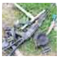
Российни МВД-сыны Чегем районда бөлөмю РФ-ни Уголов-

ральный изилеуде болганды. Ачыкылганганыча, амалькы-чыла теракт эмда кырал эм право нызамны саклауучу ор-гандыны кылулукчуларына чабыуулуккагы бардырырга хазырлана эдиле. Амалькы-чы кызаумну келечилери 2013 жылда мамыр адамланы эмда полициячыла өлтүрөлгөнлери тохтадырылганды, ол санда Дугулубгейде МВД-ны юч офи-церин.