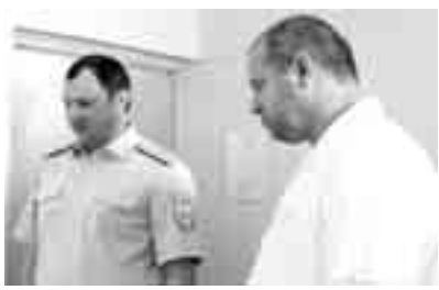
Кеслерини ишчи борчлары толтурунда кергютген ётюрюкютери ююн право

Жол-патруль службаны къулукълукъу, аманлыкълычаны автоматлары эмда гранатлары болгъанларине да къарамай, алачы жоллары тыйгъанды. Ала республикада терактла да бардырырга хазырлана эдиле.