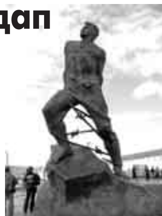
Кёкден жерге жилтинлени чачханма, Жулдуз такъяны гьаршда тутдум.

Жарыкъ кюннге жангы жолну ачханма - Жулдузлада къонакъ болуп турдум.