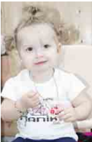
Ботталаны Аидагъа 1,5 жыл болады. Ол Бызынгыда жашайды.