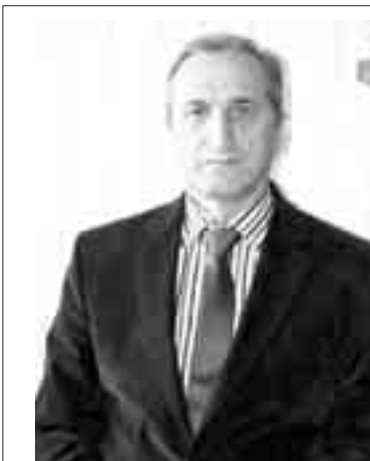
Кучмезланы Далхатны жашы Хаким.

3. Бу буйрукъ къалай толтурулганына контроль эти Къабарты-Малкъар Республиканы Правительствосуну Председателини орунбасары Р.Б. Фировну боюнча салынады.