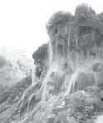
Шидакъ - къолда чучхурла.

Сѳз ючюн, Жылы - Суугъа жетгинчи, битеу ташлы сыртны аты Шырхылы