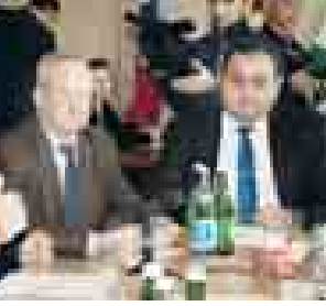
минг экзemplардан 29 мингге дери кетюрюлгенди».

«Биз тюрлю-тюрлю регионланы, тыш кыралланы окуна басма органларыны келечилери бла танышыбиз, къошуларыбызны уа ити билмейбиз,-деп, ол регионларыбызны араларында сынаууну бир бирге билдириу эки жанана да хайырлы боллугун чертгенди.