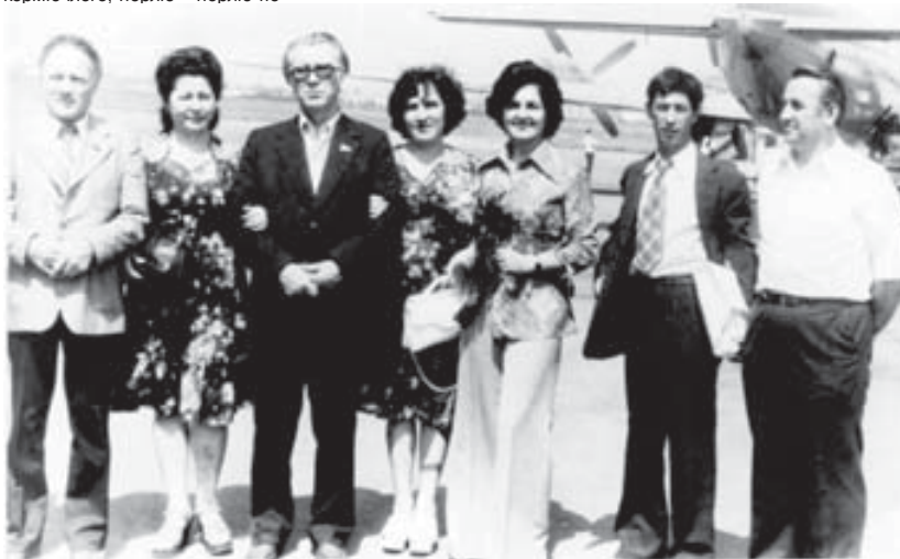
Кыбарты-Малкърны делегациясын Магрибге бла Ливиягъа ашырадыла. 1968 жыл.

- Аллай мекемеланы кыясысын ишлетген да тынч туйолдо. Сёз ючюн, Музыка театрыны кырулушу бара туруп аны башы кючю,