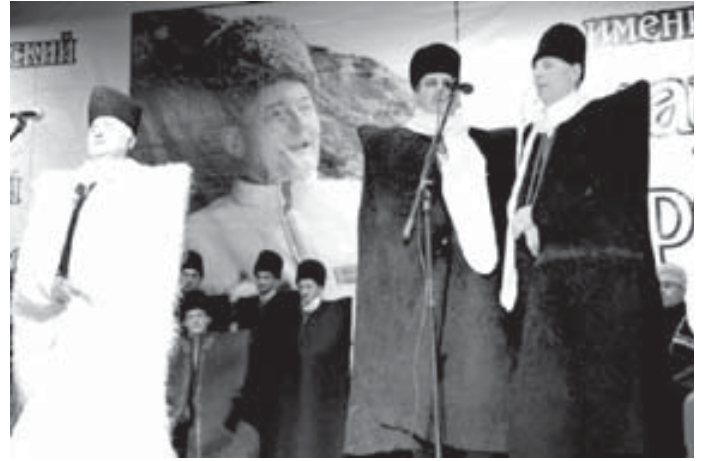
«Эрирей» ансамбль жырлайды.