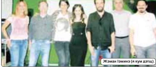
Жэман Гэминэ (я кум дэтцэ).