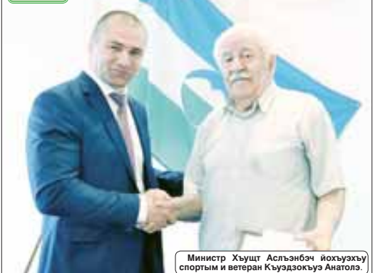
Министр Хуяцт Асьянбэч Иохвэахуу спортын и ветеран Къуэдохуэ Анаголэ.