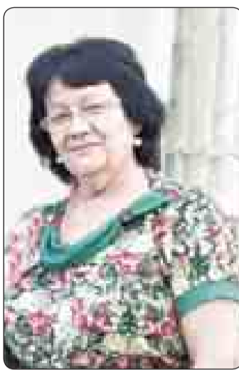
Уи благъэмрэ Иыхъыгъэмрэ.

Мэкъуауэ - Къудей Жаннэ Шыхым и пхтум дохуэхуэ и ныбжыр ильэс 60 зэрыркыумкэ.