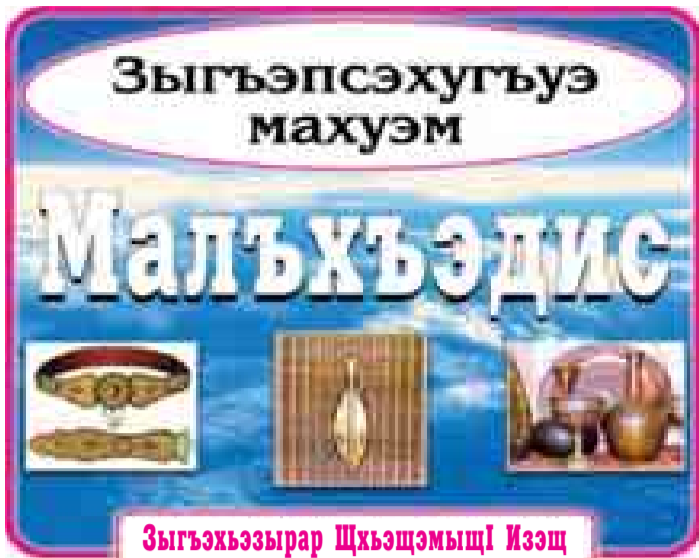
Зыгъэхъзырар Шхъэщэмшц Иэщ