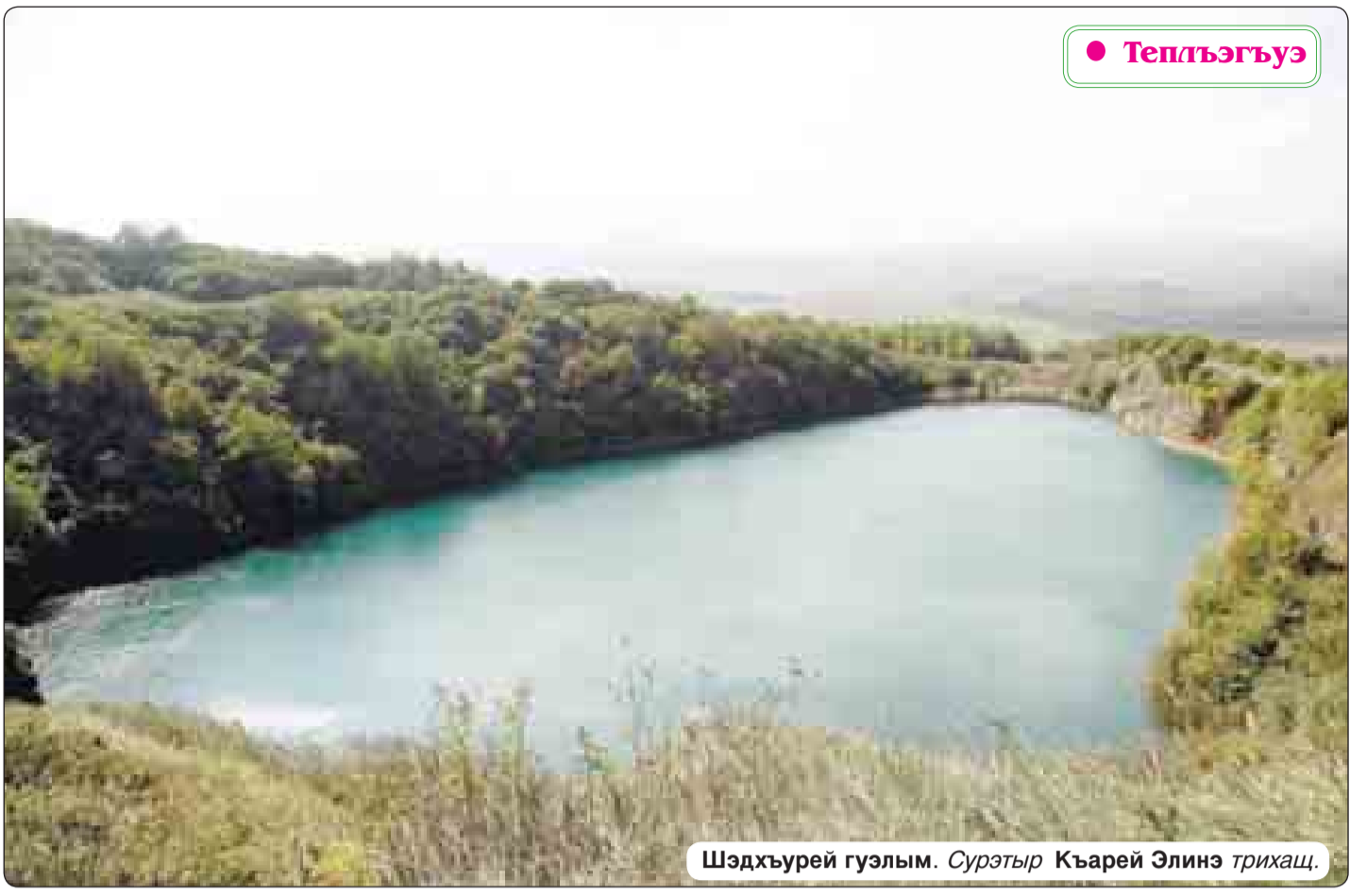
Шэдхъурей гуэлым. Сурэтэр Къарей Элинэ трихъц.