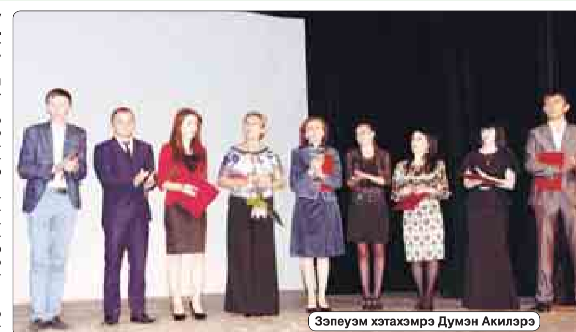
Зэпеуэм хэтхэмрэ Думэн Акилэрэ

- лутыж Борисэр сэрэ 1965 гъэм фоклэндэ и 1-м дызэрыщылуауэ шыташ. Абы лъандэрэ илэс цлэ ныкуэм шыгуащ, - жилащ Хьэ- фыццэ Мухъэмэд. - Илэс куэдкэ фылуэ дьэ- зырылгъауэ дызэныбжэгуащ, зэгъуэуи Печатым и унэм дышцызэдэлэжаш. А цыхуэ