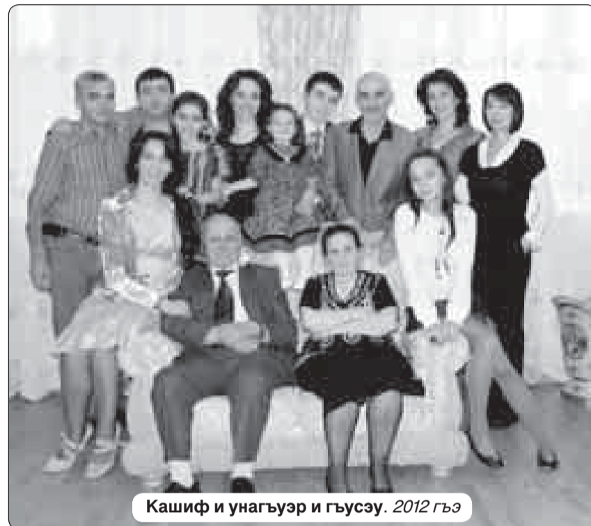
Кашиф и унагуэр и гьусу. 2012 гъэ