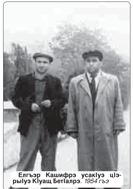
Елгээр Кашифрэ усаклэу цлэрылуэ Кіуащ Бетлэвр. 1954 гъэ