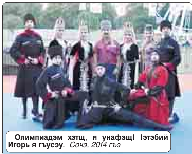
Олимпиадэм хэтщ, я унафэщ! Итэбий Игорь я гьусэу. Сочэ, 2014 гъэ