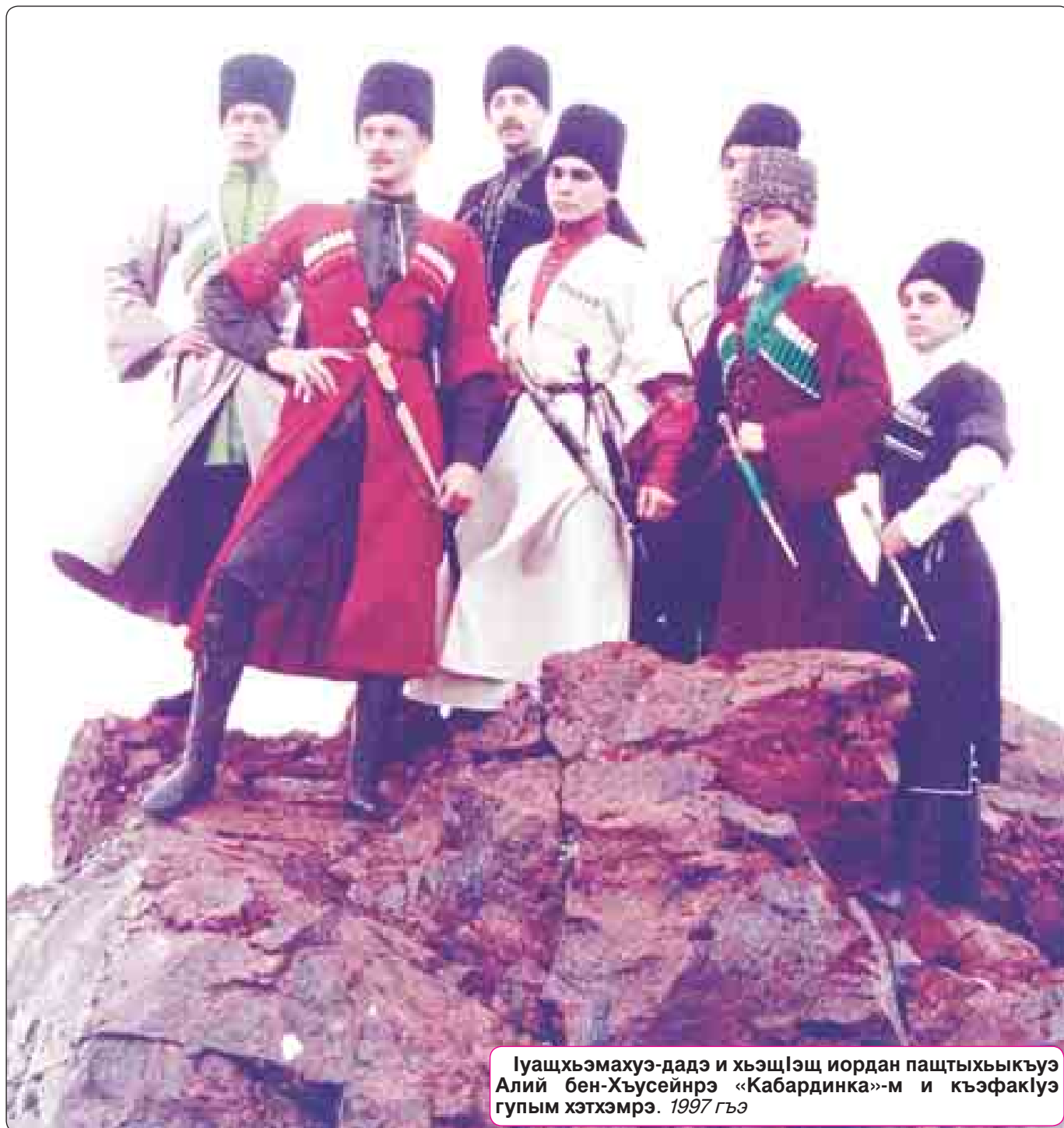
Iуашхъэмахуэ-дадэ и хъэщIэщ иордан пащтыхъыкIуэ Алий бен-Хъусейнрэ «Кабардинка»-м и къэфаклуэ гупым хэтхэмрэ. 1997 гъэ