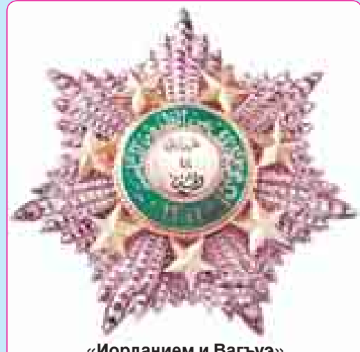
«Иорданием и Вагъуэ» орденым и япэ нагъыщэр (1985 гъэ)