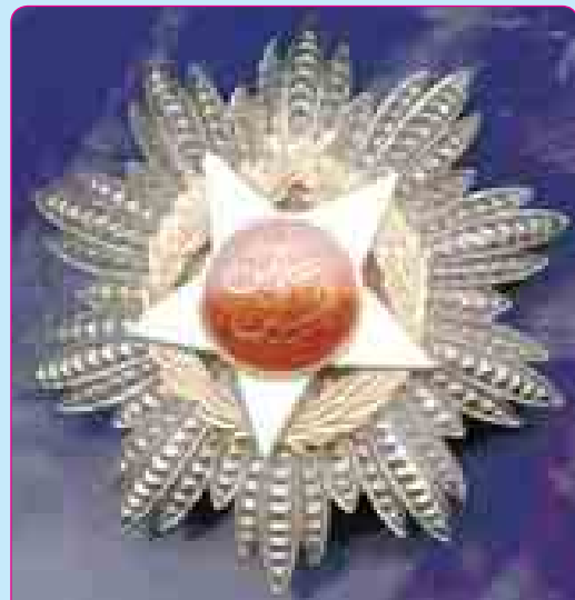
«Иорданием и щхъэхуитыныгъэ» орденым и япэ нагъыщэр (1981 гъэ)