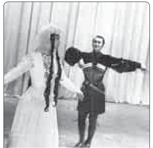
Къарэж Людмилэрэ Мэрыш Зауррэ.

Къуажэ клубыр уи гъунэгъумэ, абы лъапкэ къэфэкIэхэм шыхуагъасэмэ, ар насыптэкъэ! Дей жылэм шыщ Мэрыш Заур и IэщIагъэр абдеж къы-щэжыащ. УцIыкIуху зыхэплхэр иужькIэ къызэрыпщхэпэжыр цы-хум зэрызиужым и нэщэнэу къы-щIэкIынщ. Курыт школым шыщеджэ-ми, Заур художественнэ самодя-тельностьным хэттащ, районхэм щра-гъэклэуэклэ зэпеуэ зэхуэмьдэхэм жьджэру зыкыщыгъэлъагъуэу. 1962 гъэм ар «Терчанка»-м къыщыфаш, 1963 гъэм КъБР-м Уэрэдымрэ къа-фэмкIэ и ансамблым хыхыащ.