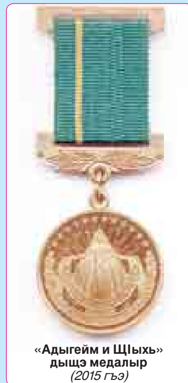
«Адыгейм и Щыыхъ» дыщэ медальыр (2015 гъэ)