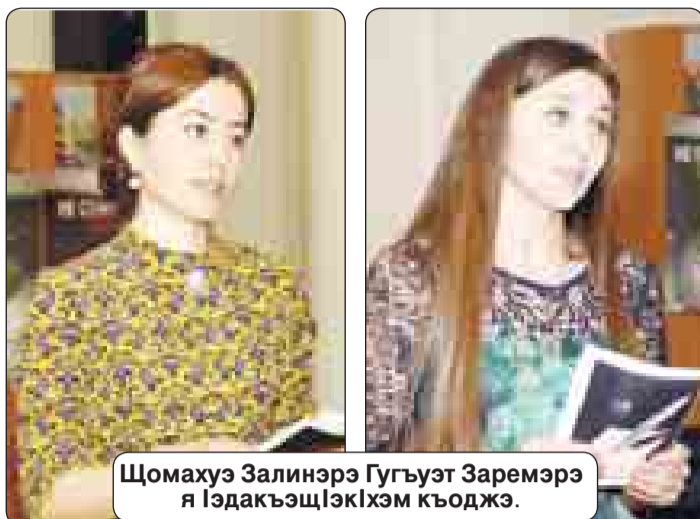
Шомахуэ Залинерэ Гугъуэт Заремарэ я IэдакъэщIэхэм къоджэ.

«ЦIыхухэр цIыху зэрыхуэрэ къыщызэралхуэу Нэхъри зэпIэщIэ хуэуэ зыдэт псыхуэм»