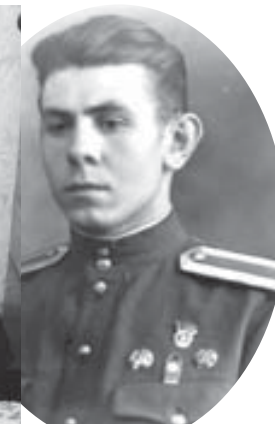
Курсант Суворовского училища, в. Орджоникидзе, 1952 г.

С этой частью дошел до Кенигсберга. Там таких, как я, собрали около двух десятков человек и со старшиной отправили в Москву в управление суворовских училищ. Но мы поехали туда в марте, а там никакого приема не было. Кто куда, а я и еще двое расположились на полигоне под Алабино, где готовили артиллеристов, танкистов, пулеметчиков. Вскоре нам доверили стоять в оцеплении по периметру этого полигона. В августе опять поехали в Москву, и меня приняли в Суворовское училище. Так я попал на Кавказ в Краснодарское суворовское училище, располагавшееся в Майкопе. Таких, как я, переростков, набрали взвод