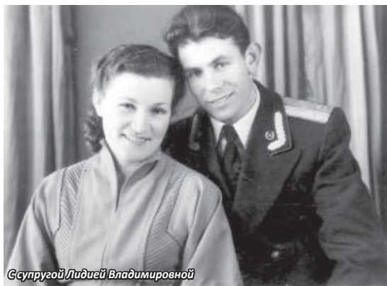
Супругой Лидией Владимировной