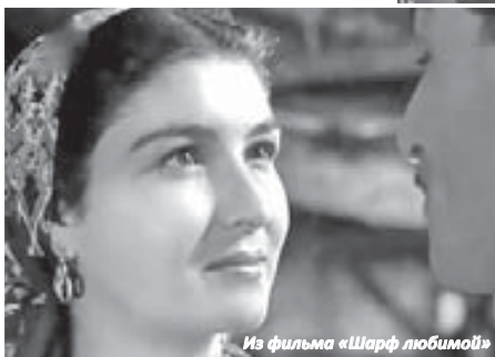
Из фильма «Шарф любимой»

на ее красивом лице постоянно лежит тень грусти; может быть, потому она так молчалива и задумчива в короткие минуты свиданий с любимым. Может быть... Но когда председатель суда вызывает свидетельницу Халимэ, и в гудящий, как улей, зал вводят девушку, лицо ее поражает необычным для нее выражением силы и твердости. Торопливо, как бы не замечая, проходит она мимо ловких репортеров, любопытных и праздных наблюдателей,