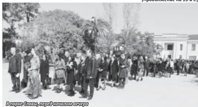
В парке Славы, перед началом вечера