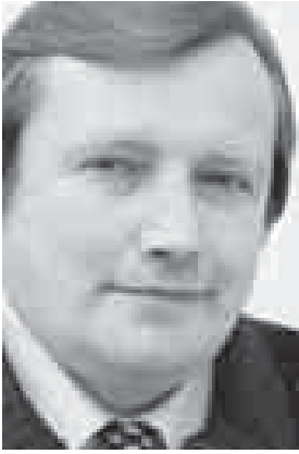
(Окончание. Начало на 4-й с.)