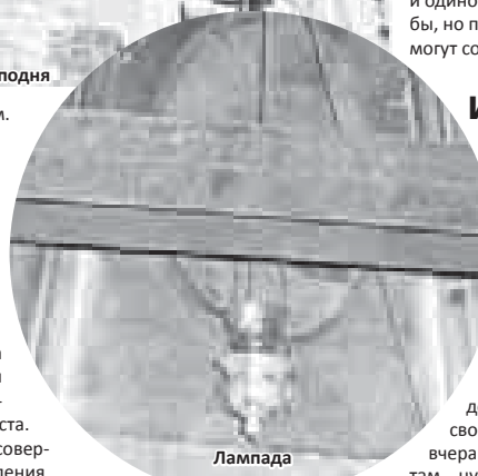
Лампада в храме