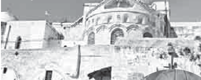
Храм Гроба Господня