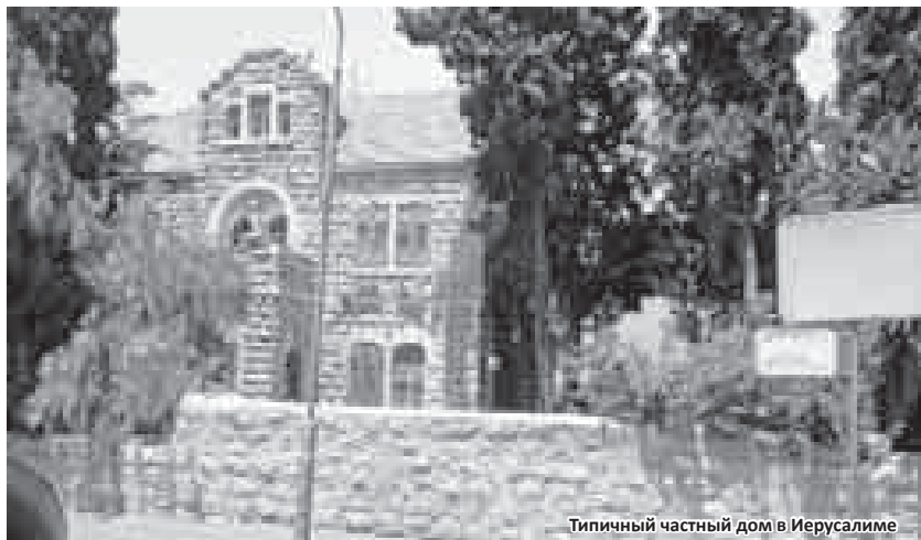
Типичный частный дом в Иерусалиме