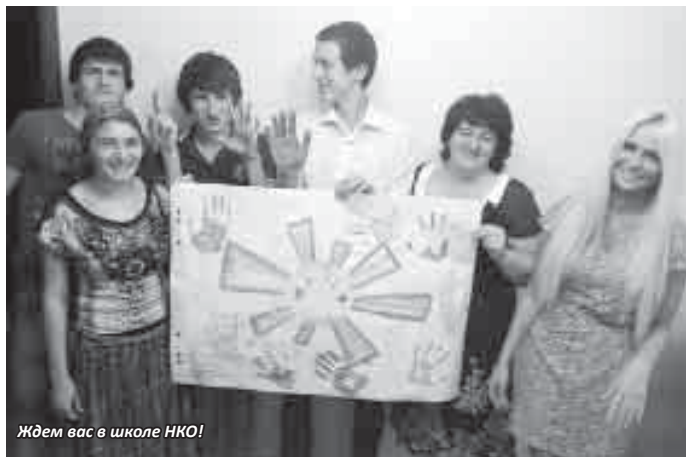
Ждем вас в школе НКО!

Тренинг для социальных тренеров прошел 10 июля. На нем обсуждались цели и задачи работы социального тренера, основные умения и навыки, которыми он должен обладать, отработывались приемы успешной коммуникации, конструктивного диалога. В тренинге приняли участие сотрудники государственных организаций, так как данные знания и