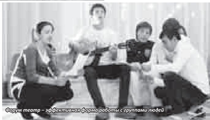
Форум театр – эффективная форма работы с группами людей

Ряд заданий и упражнений направлен на осмысление своих личностных установок и стереотипов или на оценку ситуации. Например, упражнение «Большница», при проведении которого участники искали ответы на вопросы, почему никто не посещает хорошо оборудованную больницу с профессиональными специалистами, что происходит с устной информацией, которую мы передаем друг другу, почему сотрудники не точно выполняют задания руководителя, почему заказчики получают совсем не то, что просили. Многие упражнения направле-