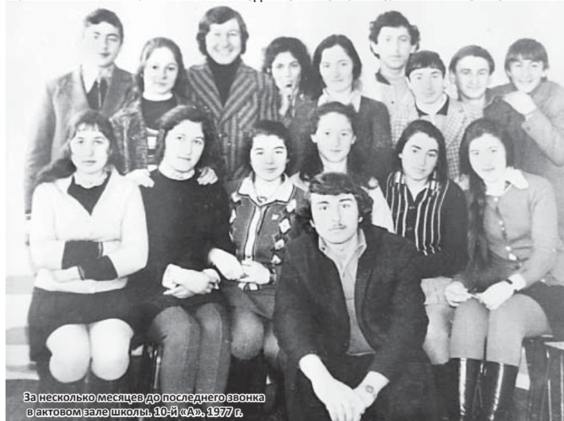
За несколько месяцев до последнего звонка в актовом зале школы. 10-й «А», 1977 г.