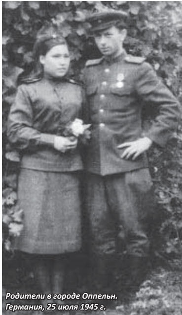
Родители в городе Оппельн. Германия, 25 июля 1945 г.