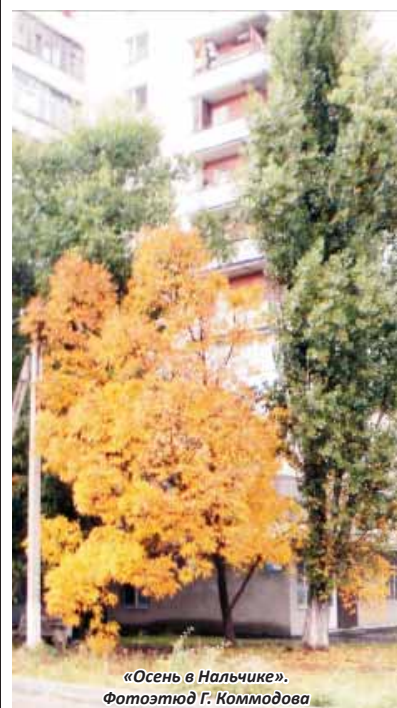
«Осень в Нальчике».