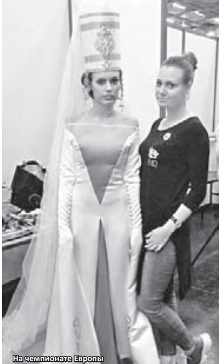
На чемпионате Европы

Сначала получила среднее специальное образование по специальности «Менеджер в организации» в профессиональном лицее №3, затем уехала в Москву, поступила в Московский гуманитарный университет, где получила высшее образование. Там училась и одновременно работала менеджером в парфюмерной компании. Но поскольку с подросткового возраста постоянно посещала с мамой тренинги и знала их специфику, из менеджера быстро перешла на должность структурного тренера. На тот момент нас было всего 12 человек в России. Тогда я научилась структурировать курсы, собирать материал, преподавать его аудитории, это важно: многие высококлассные мастера не владеют этими технологиями, поэтому не могут вести базовые курсы, ведут только курсы повышения квалификации. В моей школе можно свободно