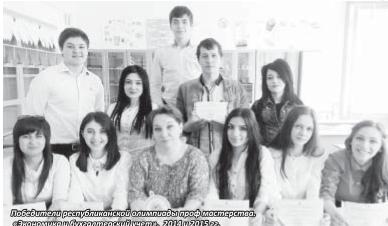
Победители республиканской олимпиады проф мастеров «Экономика и бухгалтерский учет», 2014 и 2015 гг.

интерактивными досками и компьютерами. Компьютеризация производства – необходимость сегодняшнего дня. Создано пять учебно-тренировочных лабораторий, где студенты ежедневно проходят практические занятия. В их числе кондитерский цех и учебный бар, небольшой банкетный зал.