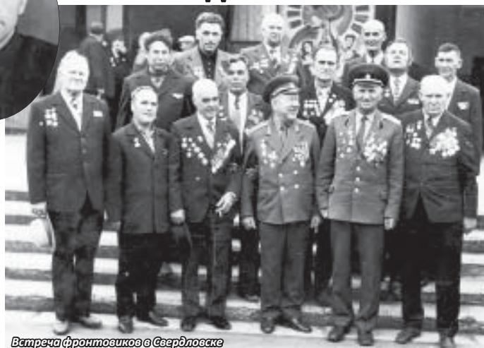
Встреча фронтовиков в Свердловске