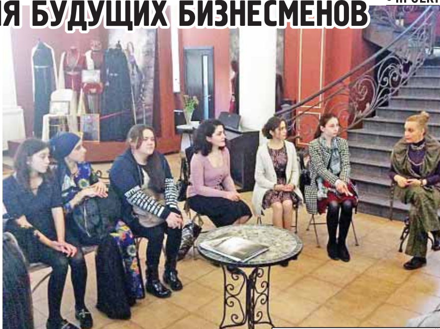
● Материалы Марины БИТОКОВОЙ

Реализовать свой творческий и интеллектуальный потенциал и в то же время зарабатывать серьезные деньги – цель многих завтрашних бизнесменов. Однако реального видения, что и как надо делать, конечно, в начале пути ни у кого нет. В итоге у начинающих предпринимателей зачастую в тот момент, когда надо переходить к действиям, возникает тысяча вопросов, ответы на которые полнее и понятнее смогут дать профессионалы.