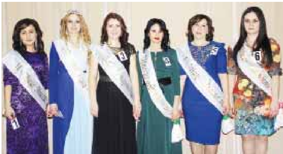
В ПРЕДВЕРИИ ДНЯ МАТЕРИ В ДОМЕ КУЛЬТУРЫ г.п. ЧЕГЕМ ПРОШЕЛ СТАВШИЙ УЖЕ ТРАДИЦИОННЫМ РАЙОННЫЙ КОНКУРС КРАСОТЫ И ТАЛАНТА ДЛЯ МАМ «МИССИС МАМА».

Все участницы конкурса с первых минут покорили публику искренностью, способностями и красотой. Все они оказались одинаково прекрасны в умении уверенно держаться на сцене, красиво и оригинально представлять себя и свою семью. Талантливые конкурсантки успешно справлялись со всеми предложенными заданиями конкурсной программы.