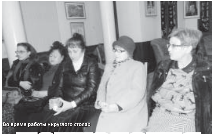
Во время работы «круглого стола»

решения по важнейшим вопросам. При них наши реки не были сточными канализациями и никто бы не пошел свои канализационные трубы вывести прямо к реке так бесовски и бездумно, как сейчас. При них, наших уважаемых верующих предках, на охоту ходили только охотники, а не все село. А в арыках текла такая чистая вода, что можно было на ней готовить. Они трепетно относились к жизни человека, деревьев, каждой травинки и, конечно, воды. Их преследовали, сажали в тюрьмы, но не смогли убить веру. Сейчас вокруг нас много людей, которые одеждой и речью подчеркивают свою религиозную принадлежность. Но при этом уровень агрессии, нетерпимости резко вырос, и волна убийств не убывает. Жизнь человека ничего не стоит. Убивают людей, убивают природу - вырубаются леса, оскверняются реки. Что можно сделать в этих условиях? Или точка невозврата уже пройдена? Участники «круглого стола» считают, что возвращение к корням, к исторической памяти способно вывести нас из критической ситуации, в которой мы находимся.