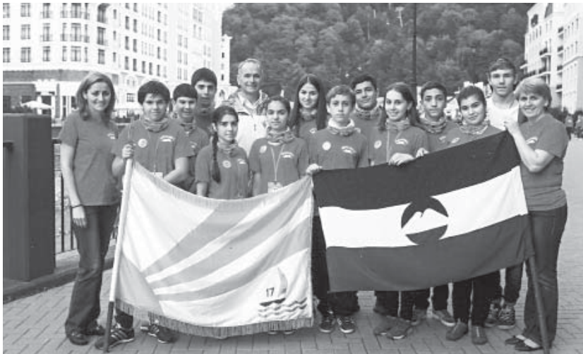
С учениками на Всероссийском молодежном спортивно-образовательном фестивале «Формула твоей мечты», курорт «Роза Хутор», г. Сочи