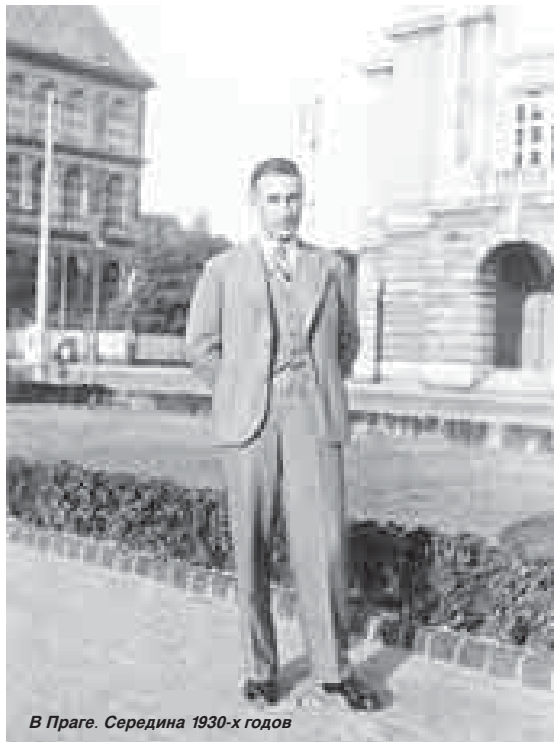
В Праге. Середина 1930-х годов

гометан Кавказа (да и не только Кавказа) следует упомянуть: это строгая почитительность к другим религиям. Каждый верующий в своего Бога заслуживает в глазах горца всяческого уважения. Напротив, всякий, кто глумится над чьей-либо верой, является в его глазах существом презренным и низменным. Конечно, во времена войны Креста и Полумесяца как христиане, так и магометане проявляли одинаковую жестокость и одинаковое варварство по отношению к чужим святыням. Но речь идёт о нормальном отношении к тому или иному культу на Кавказе.