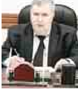
Награждён медалью «За трудовую доблесть». Почётной грамотой Кабардино-Балкарской Республики, почётными грамотами Правительства Кабардино-Балкарской Республики. Имеет звание «Почётный работник ЖХК России» и «Заслуженный работник промышленности КБР».

С 29 октября 2014 г. – и.о. главы местной администрации Эльбурского муниципального района.