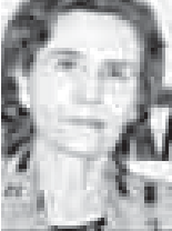
(Юношине. Начало на 1-й с.)