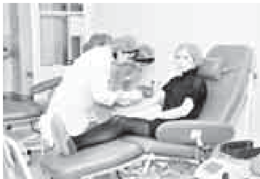
Участники акции «Леди Донор»

тели Службы крови, донорские акции важны прежде всего потому, что помогают развивать безвозмездное и регулярное донорство крови. Это является главным условием обеспечения максимальной безопасности компонентов крови для нуждающихся. Практика показывает, что добровольные доноры, которые не заинтересованы в денежном вознаграждении, предоставляют более достоверную информацию о состоянии своего здоровья. Кроме того, регулярные доноры постоянно обследуются и знают, что происходит с их организмом, насколько они здоровы.