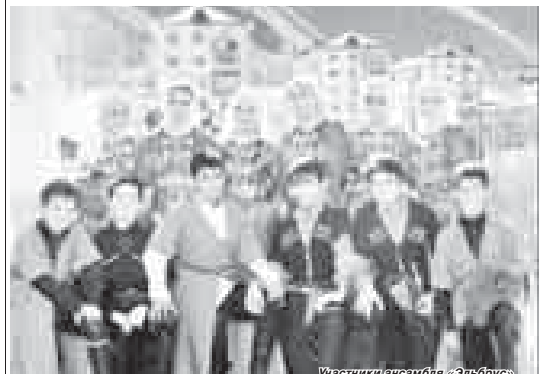
Участники ансамбля «Эльбрус»

Центр развития творчества детей и юношества Эльбрусского района имени Магомета Мокоева давно завоевал репутацию одного из лучших учреждений дополнительного образования не только нашей республики, но и страны. Очередное признание его заслуг — звание лауреата, диплом и золотая медаль Всероссийского конкурса «100 лучших школ России».