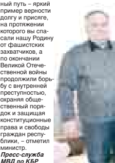
Пресс-служба МВД по КБР

— Ваш жизненный путь — яркий пример верности долгу и присяге, на протяжении которого вы спали нашу Родину от фашистских захватчиков, а по окончании Великой Отечественной войны продолжили борьбу с внутренней преступностью, охраняя общественный порядок и защищая конституционные права и свободы граждан республики, — отметил министр.