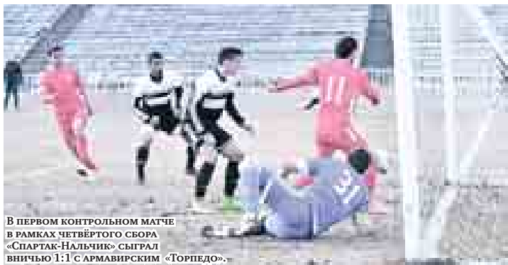
В ПЕРВОМ КОНТРОЛЬНОМ МАТЧЕ В РАМКАХ ЧЕТВЕРТОГО СБОРА «СПАРТАК-НАЛЬЧИК» СЫГРАЛ ВНИЧЬЮ 1:1 С АРМАВИРСКИМ «ТОРПЕДО».

Товарищеская встреча на стадионе «Центральный» в Кисловодске получилась в целом равной. Обе команды старались показать качественный футбол, но было заметно, что футболисты соперничающих команд ещё не набрали лучшие игровые кондиции. Да и качество натурального газона стадиона оставляло желать лучшего.