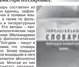
Построен словарь следующим образом. Разбика слов произведена по разделам...