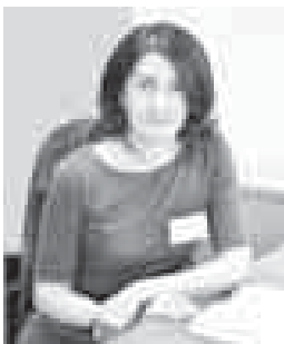
Формы организации обучения, новых образовательных технологий, новой открытой информационно-образовательной среды...