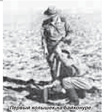
Первый колёшечка на Байконуре

*** В восьмидесятые годы минувшего века осуществлялось много совместных космических полётов. На Байконур приезжали французы, индийцы, вьетнамцы. О том, что прибыла очередная зарубежная делегация, мы узнавали... по нашим шоферам. Ведь они иногда навещали в город Ленинск, которого не было на обычных географических картах Советского Союза. Байконур представлял из себя гигантское скопление военных частей. Практически, перелезая через забор, можно было попасть из одной части в другую. А в закрытом секретном городе Ленинске, которого вроде бы как и не было, жили семьи офицеров, прапорщиков и незначительное количество вольнонаёмных. Когда же прибывали иностранцы, для сохранения великой государственной тайны город преображался – военные передодевались в гражданскую одежду. Такой тихий мирный город Ленинск. Солдат, по роду службы бывавших в городе, также передодевали в гражданское неизвестно из каких стратегических гардеробов. Причём одежду выдавали им весьма качественную. И наши шоферы в фирменных джинсах и рубашечках, в кроссовках, проезжая мимо марширующих солдатских колонн из своей части, любили по какой-нибудь надуманной причине специально остановиться, чтобы поприветствовать сослуживцев, хотя им это было запрещено. А нам оставалось им только