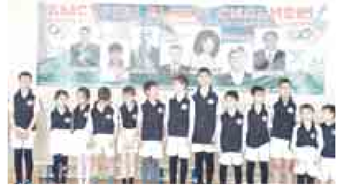
Материалы подготовил Альберт Дышеков

ОБЪЯВЛЕНИЯ 42-69-96 E-mail: kbek@mail.ru РЕКЛАМА 42-69-96 E-mail: kbek@mail.ru ОБЪЯВЛЕНИЯ 42-69-96 E-mail: kbek@mail.ru РЕКЛАМА 42-69-96 E-mail: kbek@mail.ru ОБЪЯВЛЕНИЯ