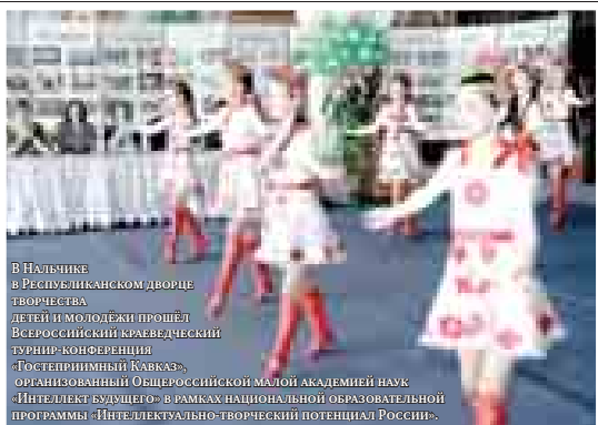
В Нальчике в Республиканском дворце культуры в рамках 10-летнего юбилея прошел Всероссийский краеведческий турнир-конференция «Гостеприимный Кавказ».

Участниками конференции стали 117 российских школьников, прошедших значимые конкурсы «Познание и творчество», «Интеллект-экспресс», «Креативность. Интеллект. Талант».