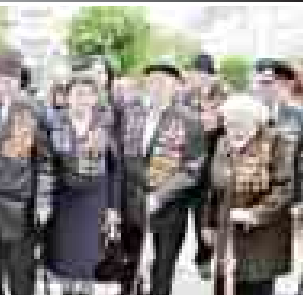
втором этаже здания администрации гости перерезали красную ленточку, открывая доступ к экспозиции, рассказывающей о жизни города в годы Великой Отечественной войны. Здесь выставлены старые фотографии, которые знакомят с историей формирования 115-й кавдивизии, противостояния горцам в период оккупации, а также показывают, как преобразился Нальчик за годы мирной жизни. Ветеранам вручили подарки, для них подготовили концерт воспитанники детского сада №74 в восьмой школы. Ольга КЕРТИБЕВА